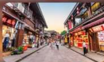
หมู่บ้านโบราณฉือซีไห่