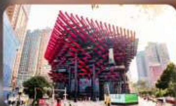
ดิคตะเกียบ