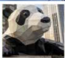
ห้าง IFS หมีแพนด้าเป็นตึก