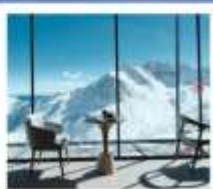
4860 COFFEE SHOP