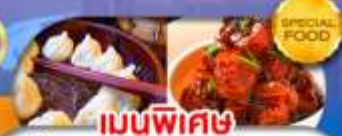
เมนูพิเศษ เสี่ยวหลงเปา หมูน้ำแดง เดินทาง ต.ค. 69 - มี.ค. 70