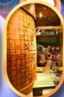
ร้านสตาร์บักส์