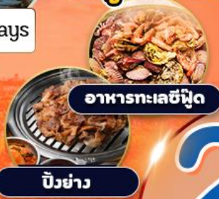
อาหารทะเลซีฟู้ด