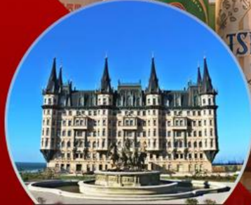
คฤหาสน์เวินเจียง