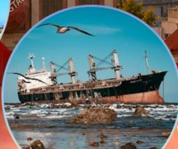
เรืออัปปาง Blueways