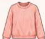
เสื้อสเวตเตอร์ถัก หรือคาร์ดิแกน