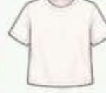
เสื้อยืด