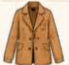
เสื้อแจ็กเก็ต หรือโค้ทตัวยาว