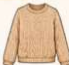
เสื้อไหมพรม