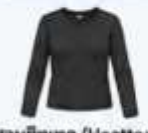
สวมฮีตเทค (Heattech) แบบหนาพิเศษด้านใน