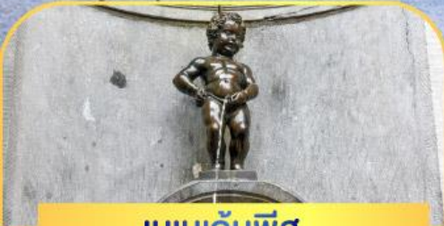
เมเนกันพีส