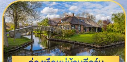
ล่องเรือหมู่บ้านทีรูร์น