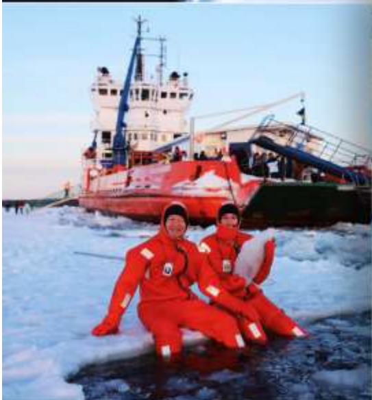
Polar Icebreaker Apr 2027