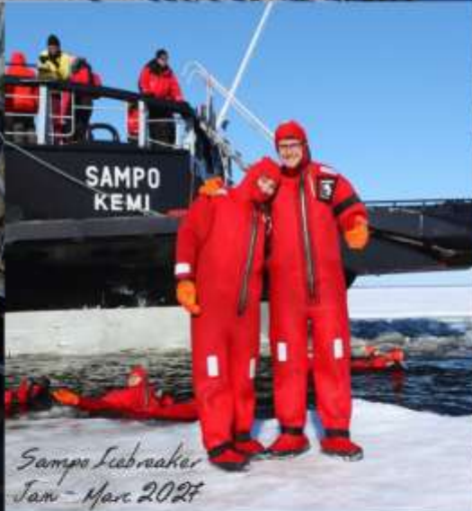
Sampo Icebreaker Jan - Marc 2027