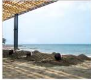
อามทรายร้อย