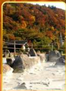
หุบเขานรกอุเนเซน