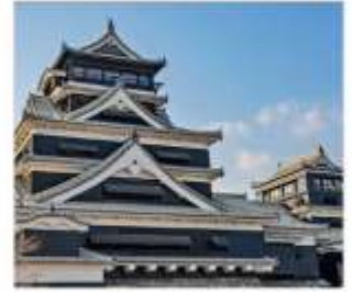
ปราสาทคามาโมตะ