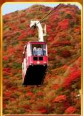
กระเช้าลอยฟ้าอุเนเซน