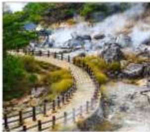
หุบเขานรกอุเซ็น