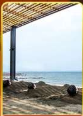
อาบทรายร้อน