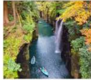
หุบเขาทาดาจิโฮะ