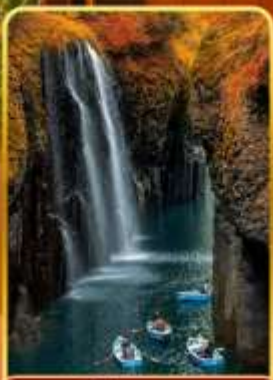
ทาคาจิโอะ(ไม่รวมสองเรือ)