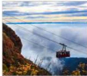
นั่งกระเช้าลอยฟ้าอุเซ็น