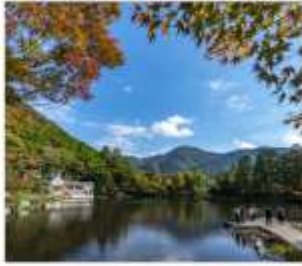
ยูฟูอิน(ทะเลสาบคิริน)