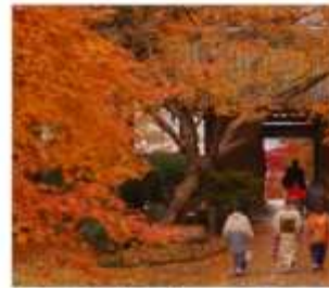
วัดไดโตะเซนจิ