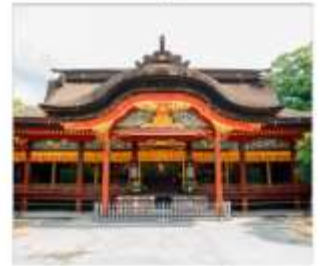
ศาลเจ้าดาไซฟู