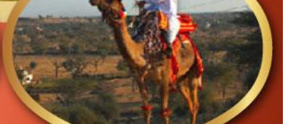
ฟรี ขี่อูฐ เมืองมันทวา ราคาเริ่มต้น