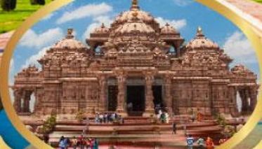
วิหารอักซาร์คัม