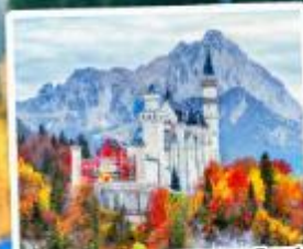
ปราสาทน้อยชวานส์ไตน์