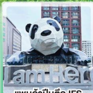
แพนด้าป็นตึก IFS