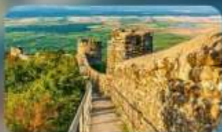
กำแพงเมืองโบราณซิกนากี