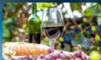
พิเศษ!! ซิมไวน์ท้องถิ่น