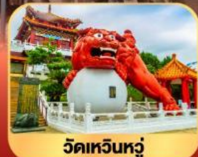
วัดเหวินหนู่